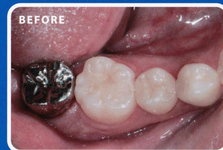
従来の金属クラウン(かぶせもの)

体に優しく、白くて、丈夫な素材 〈ジルコニア〉の特性を フルに使ったクラウンです。