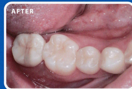
ゼノスタークラウン